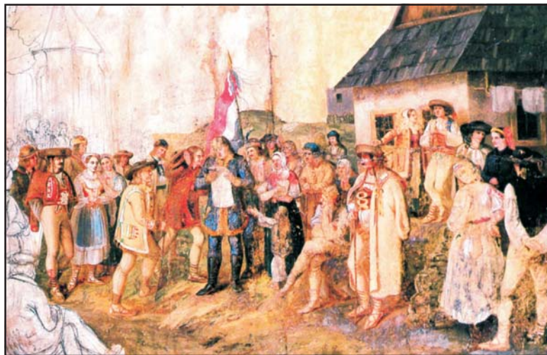
Az 1848. áprilisi törvények kihirdetése a felvidéki Liptó környékén. P. M. Bohún olajfestménye