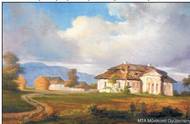
Nemesi kastély, körülötte parasztházak. Jakobey Károly olajfestménye Kazinczy Ferenc kúriájáról, 1858