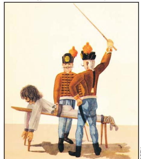
Jobbágy deresen. Vízfestmény, 1793