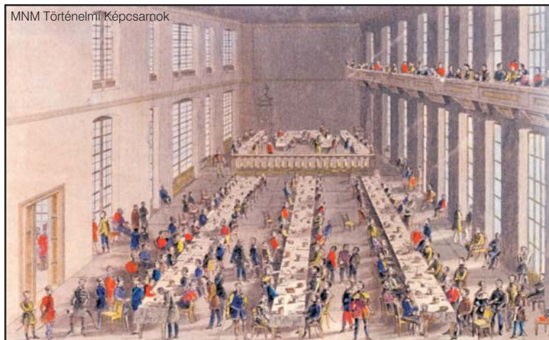
Az alsótábla ülésterme az 1836-os pozsonyi országgyűlésen. A. J. Groitsch korabeli színezett acélmetszete

Arra természetesen lehetett hivatkozni, hogy a királyi rendelet nem törvény, azt azonban nem lehetett tagadni, hogy az 1790–1791. évi országgyűlés el-