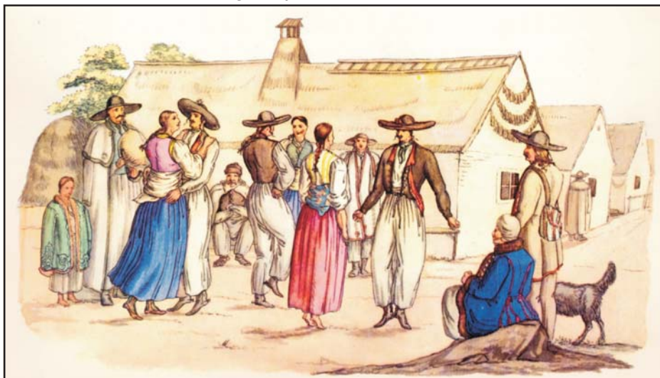
Esküvői multság Adonyban. Német vázlatfüzet részlete, 1822

A Hármaskönyv a jobbágy használatában és az uraság kezelésében lévő földeket egyaránt földesúri tulajdonnak tekintette. Elismerte emellett azonban a jobbágy öröklését (örökös jogát) a kezén lévő földekben. Amikor azt állapítja meg, hogy a jobbágy birtokának elidegenítésével csak munkájának bérét és jutalmát ruházhatja át, ezt a bért azonosnak tekintette az ingatlan közbecsújával, ami az örökbecsűnek, a valóságos érték tizedének felelt meg. Ezzel azonban azt is tudomásul vette, hogy a földesurak „teljes” tulajdona nem foglalja magában a jobbágy használatában lévő ingatlanok tizedrészét. Ellenszol-