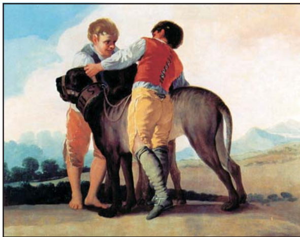
Spanyol masztiff Francisco Goya festményén, 1786–1787 körül

1495. március 24-én Hispaniola szigetén Caonabo kacike ellen vonult fel Kolumbusz Kristóf testvére, Bartolomé. A spanyol erő 200 emberből, 20 lóból és 20 kutyából állt. A kutyákat Alonso de Ojedára bízta, mivel a mórok elleni küzdelemben már elég tapasztalatot szerzett a kutyák irányításában. Ojeda a jobbszárnyon gyűjtötte össze a harci ebeket, onnan engedte el őket „Tómalos! (Kapt el!)” felkiáltással. Bartolomeo de las Casas úgy számolt be erről az eseményről, hogy egy kutya körülbelül 100 indiánnal végzett. Magyarozatképpen hozzátette, hogy ezen azért nem kell meglepődni, mivel ezeket az ebeket eredetileg vadászatra képezték ki, a vért nélküli bennszülöt-