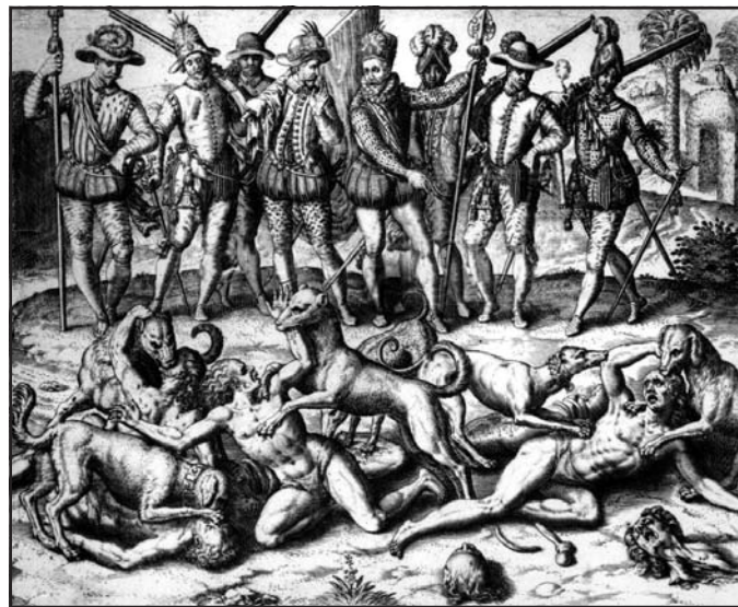
Theodor de Bray illusztrációi Las Casas művéhez az indiánokkal szembeni kegyetlenkedésekről, 16. század