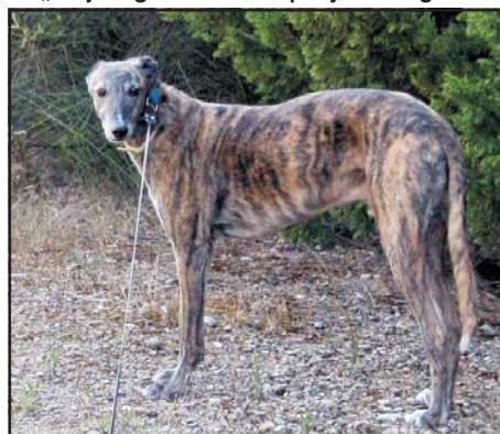
Spanyol agár. A kiváló képességű vadászkutyát sok esetben brutális módon „tartják” gazdái a mai Spanyolországban

tyákat, hanem sokszor kegyetlen kedvtelésből is ráuszították őket a bennszülöttekre. Pedro Cieza de León például a következőket írja: Cartagenában „...egy portugál, Roque Martín belépett az indiánok házaiba azért, hogy a kutyák felfalják őket, ez volt az egyetlen táplálékuk”. Garcilaso de la Vega (1501–1536) egyik munkájában olvasható, hogy „Floridában Pánfilo de Narváez spanyoljai egy olyan dolgot tettek Ocita kacikével, amit soha nem felejt el: édesanyját a kutyák elé vetették, hogy széttépjék és felfalják őt”. Hernan Colón „Az Admirális története” című könyvében a következőket állította: „1503 márciusában Veragua kaszikéje, Quibio megtámadta a keresztények települését, e támadás során sokan meghaltak és megsebesültek [...] az indiánokat kard által büntették meg és egy kutya által, aki üldözte őket, amíg csak menekülni tudtak.”