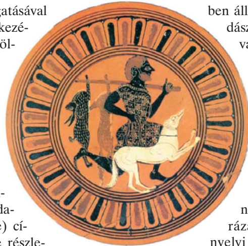
Vadász kutyájával és a zsákmánnyal. Görög vázákép, Kr. e. 500 körül

Az ógörög nyelvben a küón = kutya szó etimológiai összefüggésben áll a künégosz = vadász, künégetiké = vadászat művészete és hasonló jelentésű szavakkal. Az utóbbi adja a témáját a Kr. e. 5–4. század fordulóján alkotó hadvezér és szakíró, Xenophón művének, amely magyarázatot ad erre a nyelvi jelenségre. Az írásból kiderül, hogy a vadászat elképzelhetetlen volt kutyák közreműködése nélkül. A nagyvadak, mint