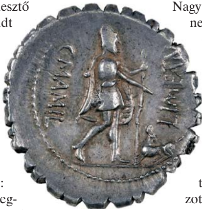
Odüsszeusz és kutyája, Argosz római pénzérmén, Kr. e. 82

Nagy Sándor, Arisztotelész neveltje, a világ anyagi és szellemi értékeire nyitott makedón király okkal háborodott fel a barbár szokáson. Persze ismerte ő a kutya kettős természetét, amelyet kedvenc költője, Homérosz is többször hangsúlyozott. Hiszen ez az állat nemcsak az ember jó barátja, hűséges társa, hanem szimbóluma a vadságnak, könyörtelenségnek, arcátlanságnak. Egyfelől a „kutyahúség” prototípusa Argosz, Odüsszeusz kutyája, aki hűszévi távollét után hazatérő urát még felismerte: „Argosz, az eb, hát tet-