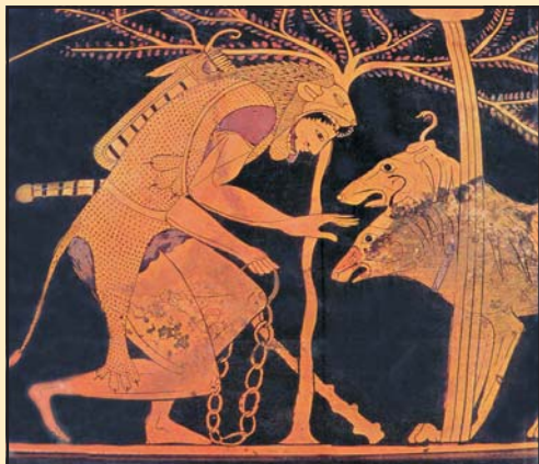
Héraklész és a mitikus kutyaszörny, Kerberosz. Görög vázákép, Kr. e. 5. század