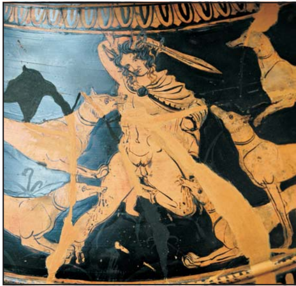
A sértett Artemisz bosszújaként Aktaiónt saját kutyái tépték szét. Görög vázákép, Kr. e. 4. század

Az isteni lények és a kutyák közötti feltételezett kapcsolat tükröződött a görögök, makedónok és a rómaiak vallási életében is. A kutya Arész hadisten kedvenc állata volt, és az isten sisakját több ábrázoláson kutya díszíti. Spárta harcias ifjúsága kölyökkutyákat áldozott a férfias istenség tiszteletére. De használták a kutya vérének tisztító szertartások végrehajtásánál is. A történetíró Plutarkhosztól (kb. Kr. u. 45–120) tudjuk, hogy hazája, Boiótia népe egy kutya kettéhasított teste között átvonulva kívánt megszabadulni bűneitől. Livius és Curtius római történetírók több mint kétezer esztendeje a makedón katonaság különös kultikus szokására hívták föl a figyelmet. Arról tudósítottak, hogy seregszeme alkalmazásával az egész had felsorakozott, majd egy kettévágott kutya részei között vonult át, és az egész szertartást harci játék követte. Miután hasonló