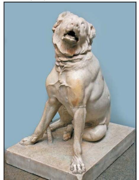
A főként őrzésre használt molosszosz. Ógörög szobor római másolata

1. Molosszosz . Eredeti tenyésztési helye Épeirosz tartomány volt a mai Görögország északnyugati részén. A dogok típusához tartozó, igen nagy és