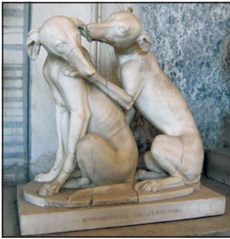
Két agár. Római márványszobor, Kr. e. 2. század

erős állat. Elsősorban a nyáj és a ház őrzésére, valamint a nagyvadak vadászatára használták. Görög szerzők gyakran „indiai”-nak is nevezték. Természetére jellemző Homérosz leírása arról, hogyan fogadták a koldusruhában felbukkanó Odüsszeust a kondás Eumaiosz kutyái: „Meglátták Odüsszeust az erőshangú ebek ekkor, / nyomban bős ugatással törtek rá...”