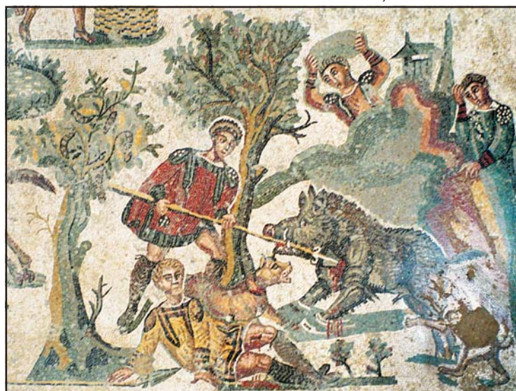
Vadkanvadászat kutyákkal az ókori Rómában. Mozaik a szicíliai Villa Romana del Casalbán, 4. század

például a vaddisznó vadászatánál mollosszal, krétai és lakóniai kutyák segítettek az állatot hajszoló embert. A vadászok először elengedtek egy lakóniait, hogy míg a többi eb pórázon maradt, addig ő kövesse a vad nyomát. Kitűnő szaglásának köszönhetően felfedezte a vaddisznó vackát, és annak helyét pontosan jelezte. A vadászok erre megkötötték őt is, majd hálót feszítettek ki, hogy a feljlesztett vadkan menekülésekor abba gabalyodjék. Mikor a háló elkészült, az összes kutyát elengedték, és azok a hálónak kergették a zsákmányt. Xenophón még azt is közli, hogy ha a vadkan nekitámadna a kutyáknak, akkor azok védelmében az embereknek kell közbelépniük, és dárdával, kövekkel hajigálva kell vagy harcképtelenné tenni a nagyvadat, vagy pedig azt más irányba terelni. A nyulak üldözésére kifejezetten a lakóniai eb kasztóri változatát vették igénybe. A szarvasok