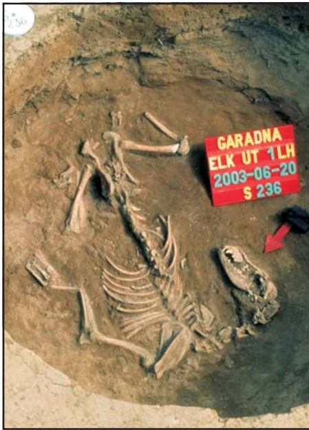
Erőszakos halált sejtet a kutya kicsavart testhelyezete. Népvándorlás kori kutya csontváz Garadna-Elkerülőút lelőhelyről