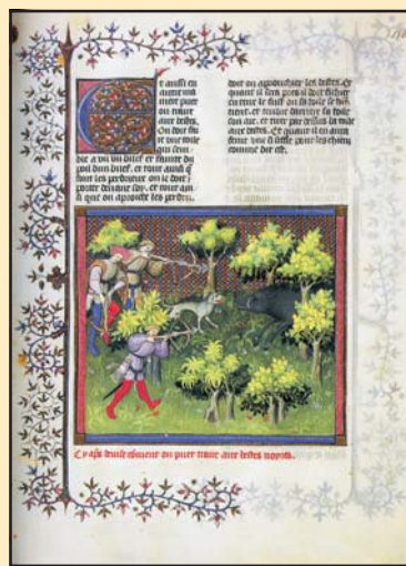
Gaston Phoebus: Livre de Chasse (1387) című művének egy lapja

profétájuk által is kedvelt macskákkal szemben.