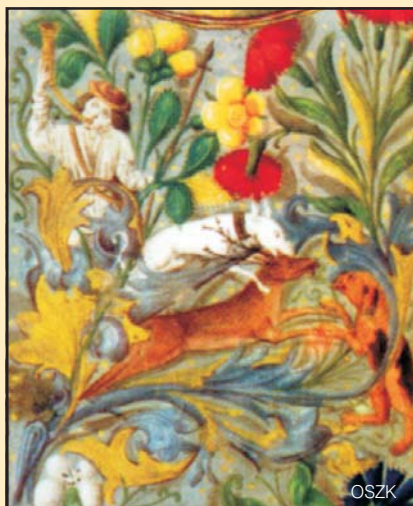
Szarvasvadászat a Mátyás-graduale lapszeldíszén, 1487 körül

A Mátyás-graduale , az egyházi év liturgikus rendjéhez igazodó, miseénekeket tartalmazó mű 1487 körül lehet készített, francia-flamand munka, s egyes miniatúrái esetleg már Budán készültek olasz iskolázottságú mester kezétől. A Krisztus feltámadását megőrkítő, húsvétvasárnaphoz kötődő fol. 3 r