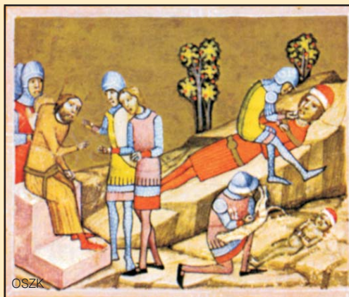
Kutyaábrázolások a Képes Krónika (1358 után) miniatúráin: A csodaszarvas-legenda – A csóri vadászat – Álmos herceg és fia, Béla megvakítása