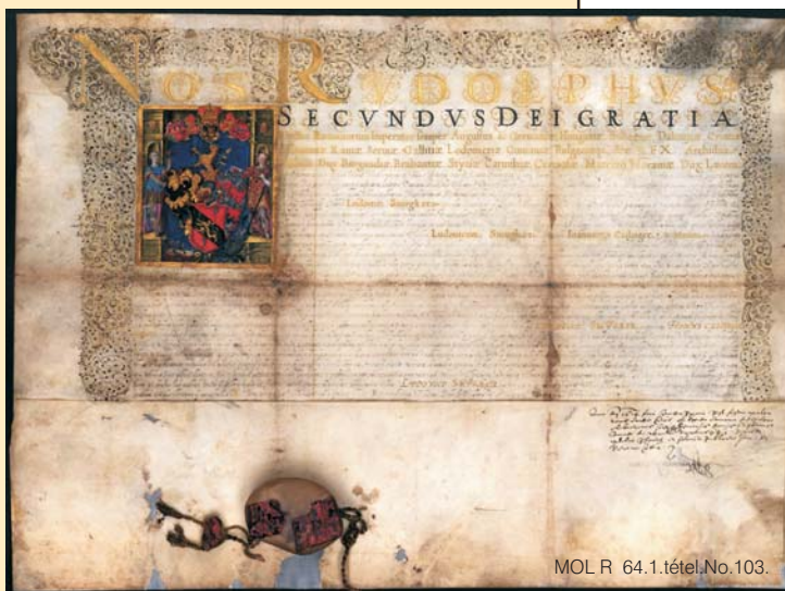
Egy valódi „kutyabőr”...

Rudolf magyar király címeradományja Smugger Lajos, nővére és annak fia, Czillinger János részére. Prága, 1601. április 2.