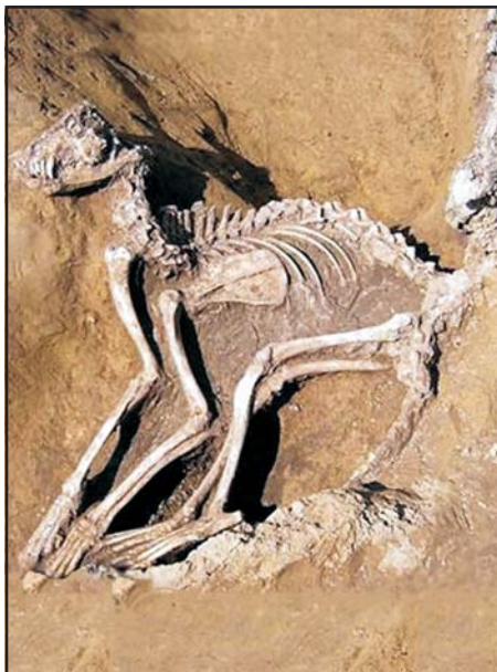
Bronzkori kutyacsontváz Kánáról

40-45 cm-es marmagasságú, boltozatos agykoponyájú spicc jellegű forma. Ezek maradványait számos közép-európai lelőhelyen megtalálták.