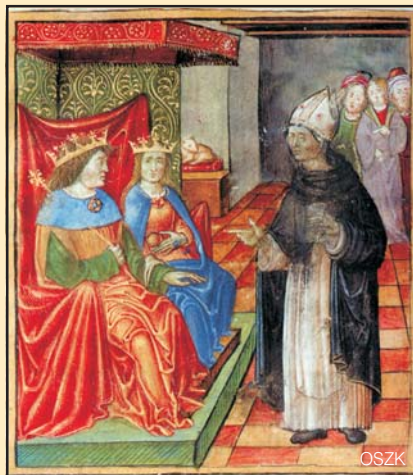
Kutya a trónteremben: Mátyás és Beatrix fogadja Ransanus püspököt. Miniatúra a Ransanus-corvinából, 1490 körül

jelzetű díszes címlap pompás lapszeldíszében ragyogó vadászjelenetet láthatunk. A buja virágok és indák szövetségében kürtös vadász riasztja társait, mivel kutyái a hajszában fiatal szarvast ugrasztanak. Az egyik már ráakaszkodott a nemes vadra, a másik talán állítani akarja. Az előbbi, a széles örves, fehér eb ék alakú fejével, rózsafüleivel, karcsú mellső végtagjával agárszerű, míg az utóbbi, a barna, fekete foltos, nagy, lógó füleivel, erőteljes fejével, inkább zömök törzsével és erős, ám kissé rövid lábaival vérebszerű benyomást kelt.