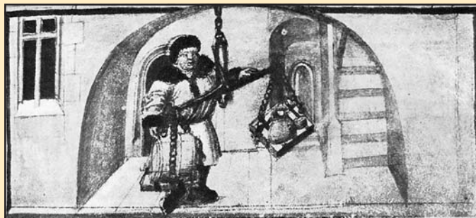
Mérlegelés az árulerakatban. Illusztráció a Prágai Missaléban, 1521