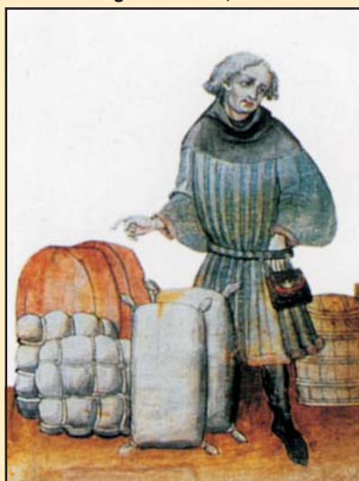
Nürnbergi kereskedő, 1440 körül

sen, illetőleg annak körzetén. Ebben az esetben két lehetőség állott fenn: vagy a városon túl már nem vihette áruját, vagy a lerakodást és az árusítást követően távozhatott a településről, és folytathatta útját. Az előbbi esetben a város jogát csak a bel- (Sopron, 1324) vagy csak a külföldi kereskedőkön érvényesíthette (Buda, 1347–1350; Kassa, 1361; Szeged, 1382; Brassó, 1395), vagy az hatályos volt a bel- és külföldi kereskedőkre egyaránt (Buda, 1361–1365; Kassa, 1399), esetenként ez belföldi kereskedőkre csak korlátozottan volt érvényben (Buda, 1402; Kassa, 1402). Ha a kereskedő tovább vihette áruját, előfordult, hogy meghatározták az ott eltöltendő napok számát is. Ezzel találkozunk Lőcsén, ahol 1321-ben I. Károly két hétben állapította meg az ott árusítással töltendő napok számát. Legtöbbször azonban erre nem került sor, csak azt tudjuk, hogy a kereskedőknek lehetőségük volt áruikat a településen túl is vinniük, a korlátozás pedig az árusok származására vonatkozott, azaz vagy a bel- és külföldi kereskedőkre egyaránt (Sopron 1402; Pozsony, 1402), vagy a külföldi és meghatározott belföldi kereskedőkre (Lőcse, 1402). A második nagyobb csoportba azokat a jogokat sorolhatjuk, amelyek egy adott területre történő belépés esetében léptek érvénybe. Azok, akik a Szepességbe mentek, elsőként Lőcsén voltak kötelesek kereskedelmi porté-