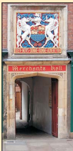
Kereskedelmi csarnok és bejárata az angliai Yorkban. Végleges formájában 1368-ban készült el

A 14. századtól megjelenő kiváltságlevek mellett a városi rendelkezéseket is figyelembe véve rendszerezhetjük a lerakat-jog egyes típusait a Magyar Királyság területén. Az első csoportba azokat a kiváltságokat sorolhatjuk, amelyek akkor léptek érvénybe, ha egy kereskedő átment egy adott települé-