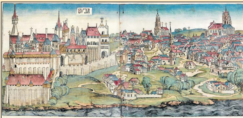
Buda látképe Hartmann Schedel krónikájában, 1493

A külföldi kereskedők a lerakatokon kívül az éves vásárokon, sokadalmakon folytathattak árucserét, a hetivásárokon való részvételüket azonban igyekeztek tiltani a különböző rendelkezések. Míg a lerakatokban az árukat csak nagy tételben