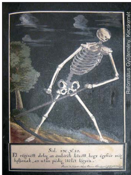
A halál megjelenítése csontvázként, kaszával. Kecskeméti anyakönyv, 1777

Az agónia jelenetében – 16 x 12 cm-es képen – ornamentális keretdíszítéssel övezve egy halálához közeledő súlyos beteg jelenik meg. Jobbján egy imakönyvet tartó férfi áll, s aggódó tekintettel, bánatosan a haldok-