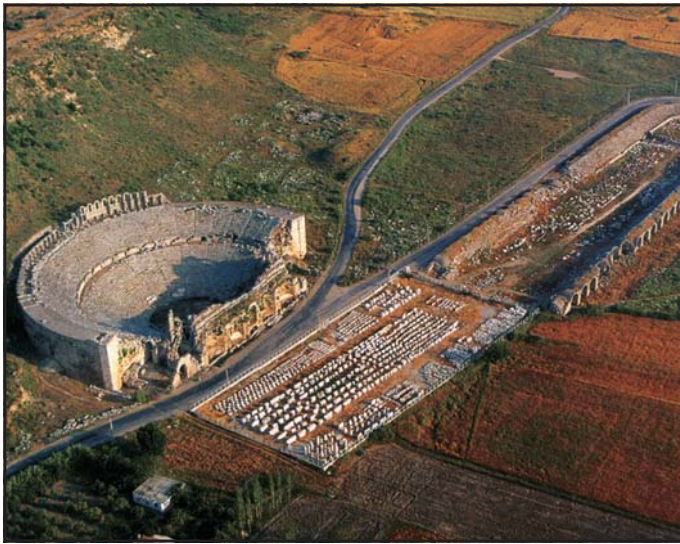
A pergamoni Aszklépiosz-szentély épületegyüttese felülnézetből