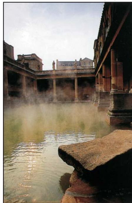
Az angliai Bath római fürdőjét ma is az eredeti vízvezetékek táplálják

Törvények című műve: „...vezető csak az lehet, akinek értelmes véleménye van (azt szereti, ami szép és jó), még ha tudatlanok is az ilyen emberek, »ahogyan mondani szokták, sem a betűvetéshez, sem az úszáshoz nem értenek«”.