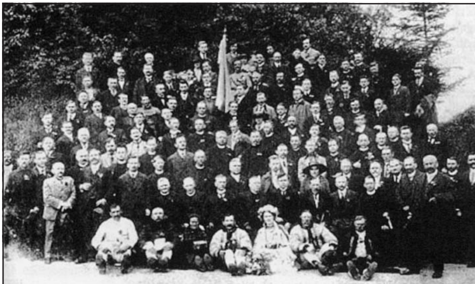
A központi Orosz (Ruszin) Nemzeti Tanács, 1919

Gömör, Borsod, Ung, Bereg és Máramaros – a Csehszlovák Köztársasághoz való csatolását azzal a feltétellel, hogy a csehszlovák állam autonómiát biztosít a többségi lakosságnak, azaz a ruszinoknak. A scrantoni döntés ről értesítettek Woodrow Wilson, az Egyesült Államok elnökét is.