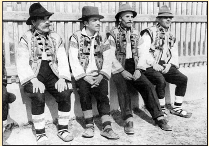
Rutén parasztek népviseletben, 1920-as évek

1944 őszén Kárpátalja és az itt élő ruszinok szovjet fennhatóság alá kerültek, és a Szovjetunióban a ruszin mint külön nemzetiség nem létezett, így ukránoknak nyilvánították őket. Az 1991 óta független Ukrajna sem ismeri el hivatalosan a ruszin nemzetiséget, szemben más országokkal, pl. a szomszédos Szlovákiával vagy Magyarországgal. Pontos számuk így megállapíthatatlan. A görögkeleti (pravoszláv) és a görög katolikus vallást gyakorolják. A kárpátaljai ruszinokat földrajzi elhelyezkedés szerint két fő csoportra oszthatjuk: a síkföldön