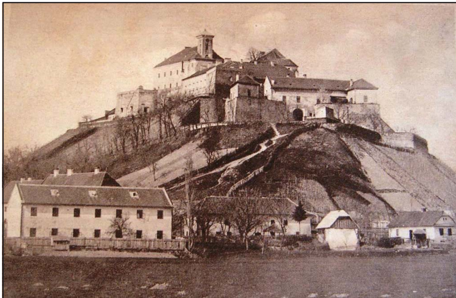
„Zrínyi Ilona munkácsi vára. A csehek kaszárnyává alakították át.” Képes hír az Érdekes Újságban, 1920