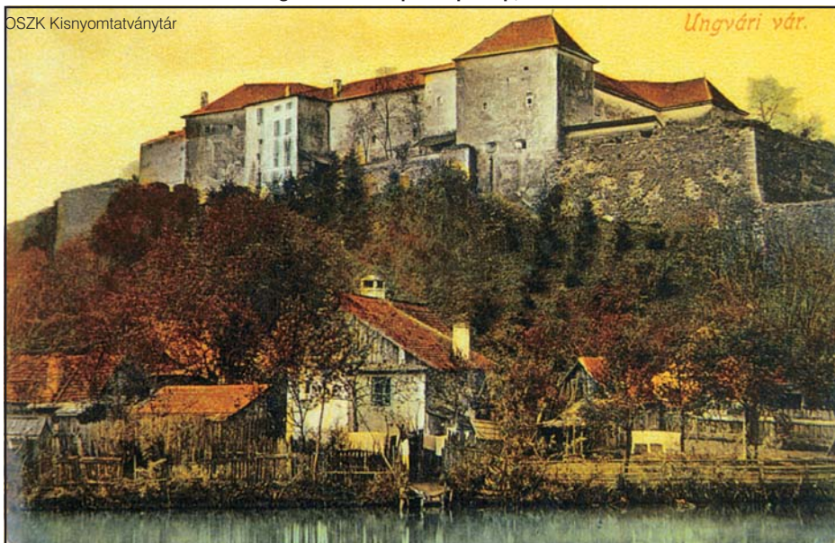
Az ungvári vár látképe. Képeslap, 1910 körül

Ezt követően, 1919. május 8-án a csehszlovák megszállás alatt levő Ungváron az eperjesi, az ungvári és a huszti ruszin tanácsok közös gyűlést tartottak, amelyen megalakították a Központi Orosz (Ruszin) Nemzeti Tanácsot, amely kimondta a Csehszlovákiához való „önkéntes” csatlakozást. Augusztusban a csehszlovák kormány elkezdte a megszállás kezdetétől fennálló katonai közigazgatás mellett a polgári igazgatás megszervezését.