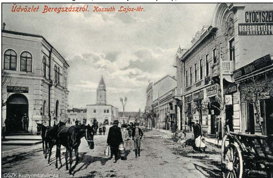
Beregszász, Kossuth Lajos tér. Képeslap, 1910-es évek

Kárpátalja magyar lakossága az államváltást és annak következményeit nehezen élte meg. Idő kellett ahhoz, hogy ráébredjenek: egy új állam fennhatósága alá kerültek. A nemzetközi szerződések megkötéséig a hétköznapi