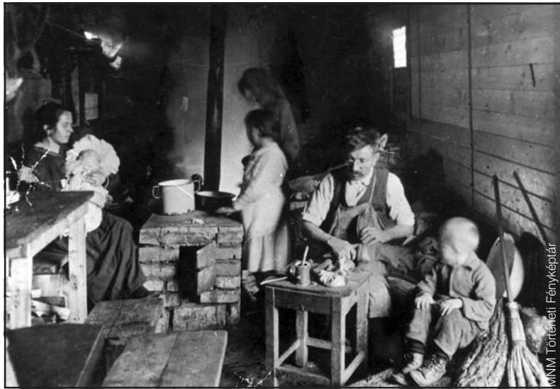
Menekült magyar család vagonlakása, 1920

1921 nyarán az „aktivisták” létrehozták a Magyar Néppártot , majd júliusban ennek integrálása érdekében a „passzivisták” egyesültek a néppártiakkal a Magyar Szövetségben , amelyet báró Jósika Sámuel, a magyar főrendiház