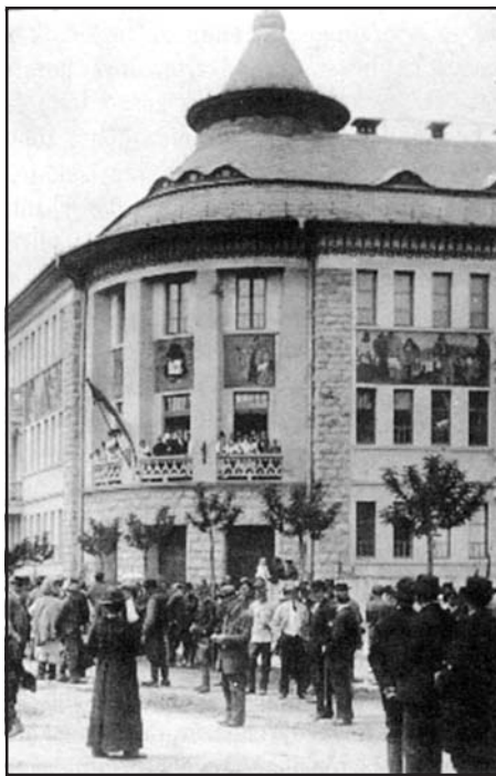
A karansebesi gimnázium épületére kítűzik a román zászlót