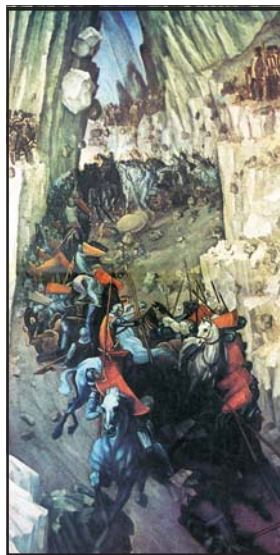
A posadai csata (1330) két felfogásban: a Képes Krónika miniatúráján (14. század) és Gh. Pătrașcu festményén (20. század)

zív kutatások folytak és folynak mindkét történetírásban a nemességet illetően, ám egymás eredményeinek összekapcsolására mindeddig csak kivételesen került sor (s nem csak a nyelvi nehézségek miatt). Pedig a középkori Magyar Királyság területén élt románság egy része a sajátos helyzetben lévő ún. partikuláris nemesség egy válfajához tartozott (azaz jogaik bizonyos vonatkozásokban elmaradtak a teljes jogú nemességet képviselő országos nemesség kiváltságainak szintjétől), s