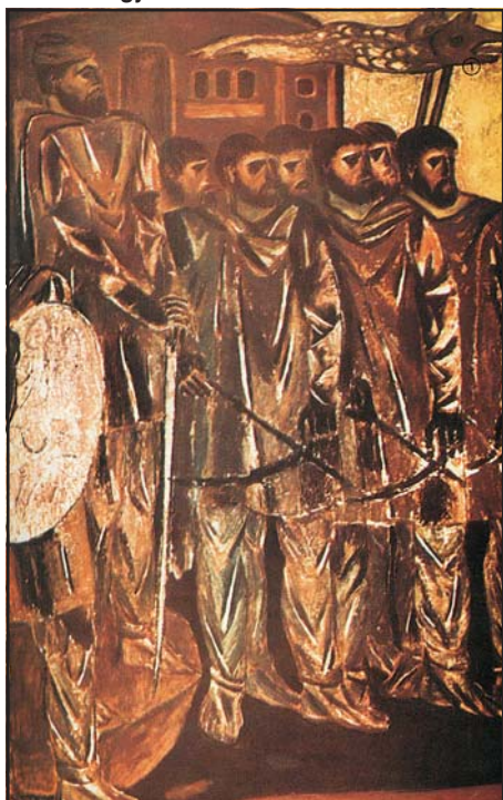
Dák harcosok. Modern triptichon részlete a gyulafehérvári múzeumban

hatnak további adatokat a kérdés megítéléséhez. Ennek elméleti lehetősége nem is tagadható, tudnivaló azonban, hogy valamely régészeti lelet(együttes) etnikumhoz kötése akkor is a legnehezebb feladatok közé tartozik, ha a kutatást nem terhelik meg a „nemzeti múlt iránti elkötelezettség”-ből fakadó elvárások. Sokkal inkább naivitásra, semmint optimizmusra van tehát szükség annak feltételezésére, hogy a megmerevedett álláspontok a belátható jövőn belül kimozdulnak a holtpontról. Ez a helyzet mindkét oldalon irritáló lehet azok számára, akik saját álláspontjuk feltétlen egyeduralomra jutásáról álmodnak, a hivatásos történész számára azonban mi sem természetesebb annál, mint hogy a saját véleményén kívül más nézetek is léteznek (még ha ezeket tévesnek is tartja).